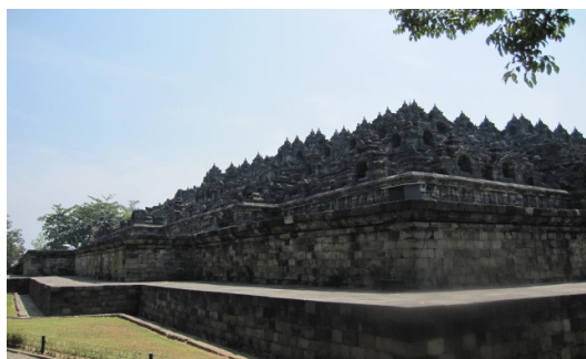
佛教神廟 (Borobudur Temple)