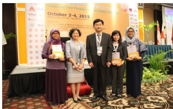
壁報論文獎得獎者與評審主委(泰國)及 AAMLS 張會長合影