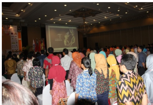
莊肅的開幕典禮演唱印尼國歌