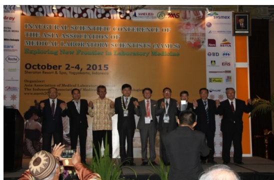
開幕式 AAMLS 會長與各會員國會長合照