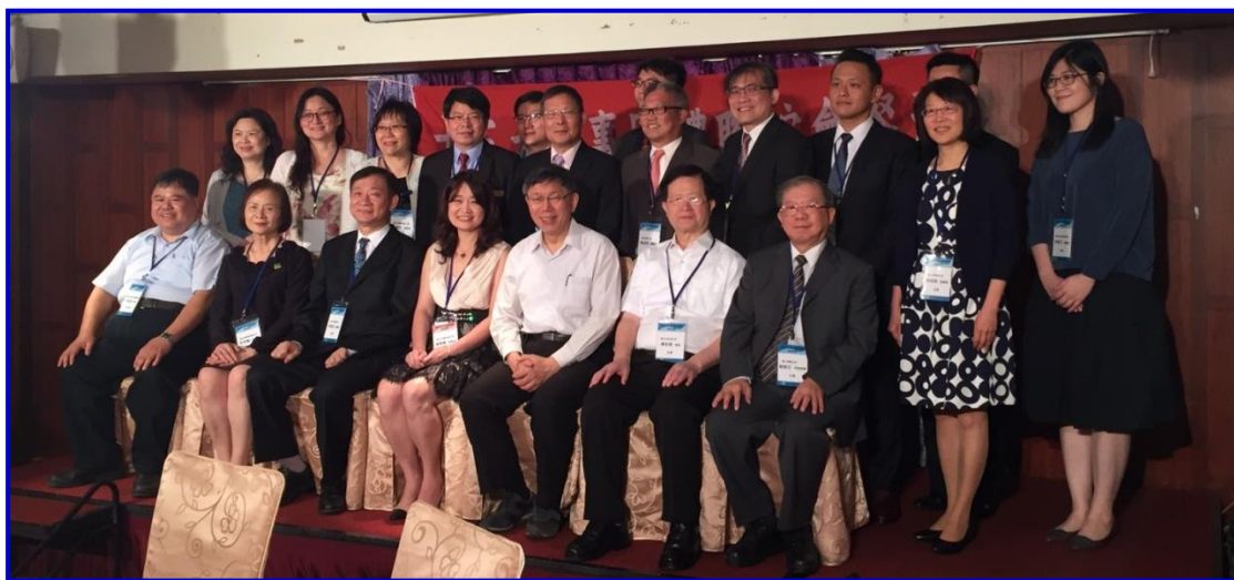
各大醫事團體代表與柯文哲市長合影