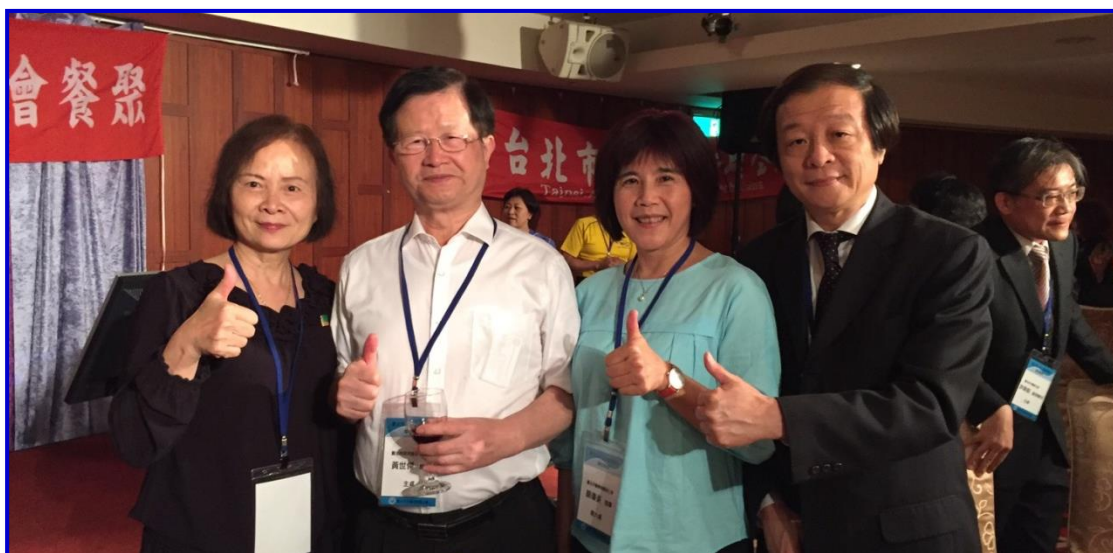
本會代表與台北市衛生局黃世傑局長合影