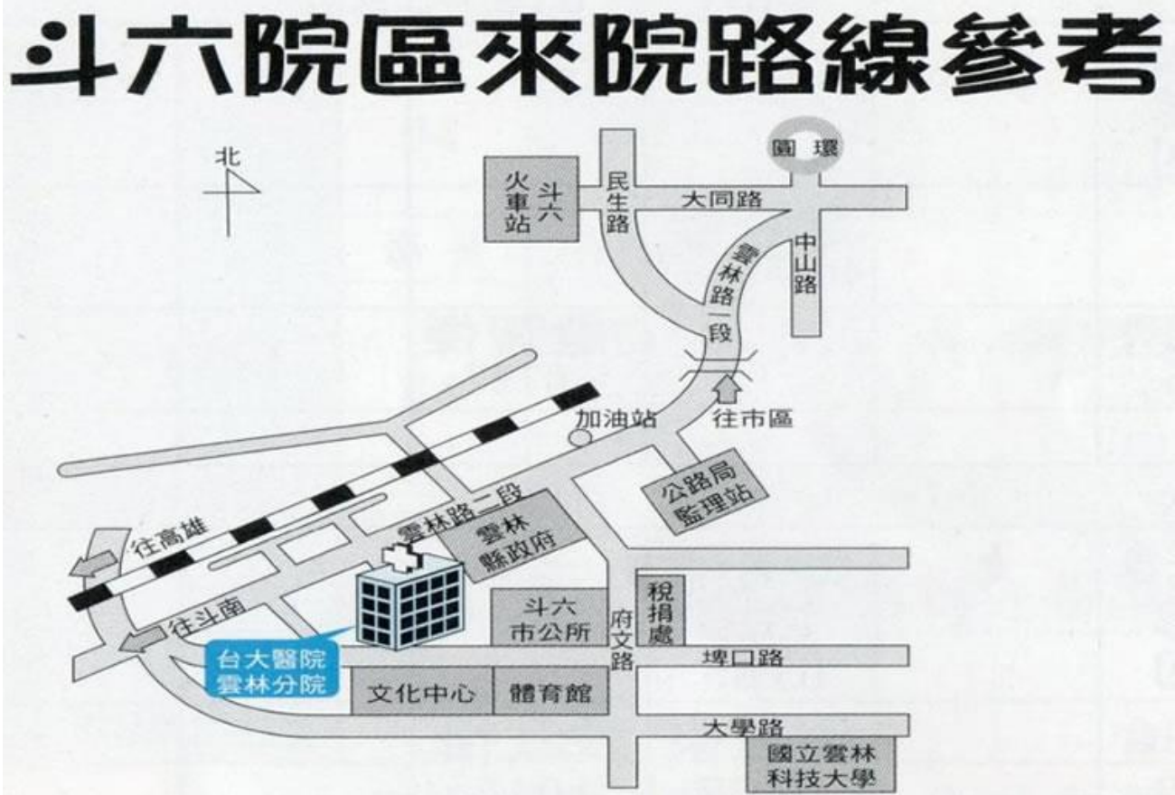
台大醫院雲林分院斗六院區 路線圖